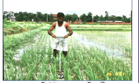
ব্রি উইডার দ্বারা নিড়ানী

লাইন ক-র রোপণকৃত অথবা বপনকৃত জমি-ত জাপানী রাইস উইডার এবং ব্রি উইডার দিয়ে আগাছা দমন করা যায়। জাপানী রাইস উইডার ও ব্রি উইডা-র অ-নক সুবিধা আ-ছ।